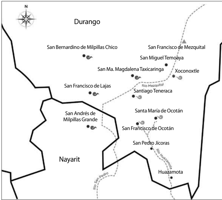
MAPA I. Comunidades y variantes lingüísticas de los tepehuanes del sur