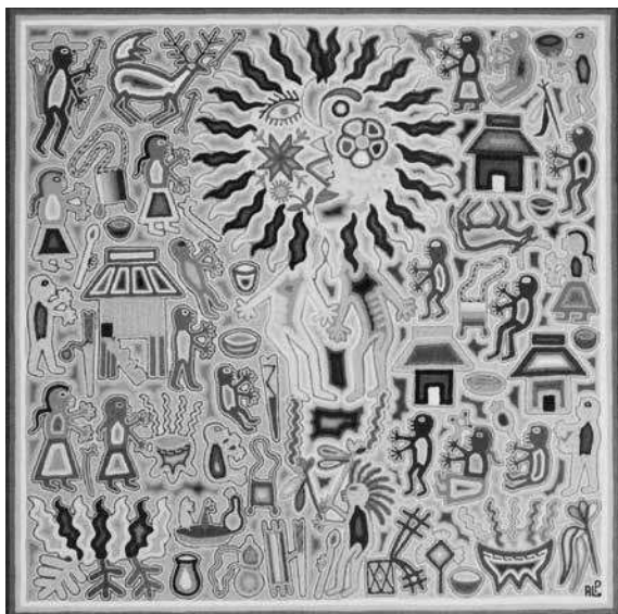
ROZENN LE MÜR ▶ Cuadro de estambre. Antonio López Pinedo, "Eclipse en el mundo huichol", Guadalajara, Jalisco, 2011.

es adulto, otro protegible. La etiqueta de vulnerabilidad, como la de pobreza, atenta contra la acción política. La desigualdad discursiva en el espacio público no favorece el arreglo político. La vulnerabilidad impide lo político en la relación entre los distintos y a los indígenas los vuelve objeto de eterna vigilancia y atención (2010: 18).