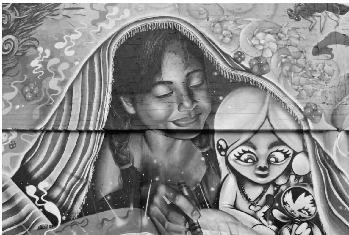
ROZENN LE MÛR ▶ Fragmento de un mural realizado por los artistas mestizos del proyecto Honghikuri, Guadalajara, Jalisco, 2014.

Estas discordias se incrementan con la falta de consideración de los códigos culturales que pueden llegar a ser muy diferentes. Muchas observaciones registradas en el trabajo de campo muestran una falta de comunicación profunda entre los huicholes y los mestizos, aunque no sea reconocida. Mi experiencia personal como extranjera en México me ha mostrado que la diferencia de códigos culturales entre distintas sociedades puede ser muy marcada. Por ejemplo, mi